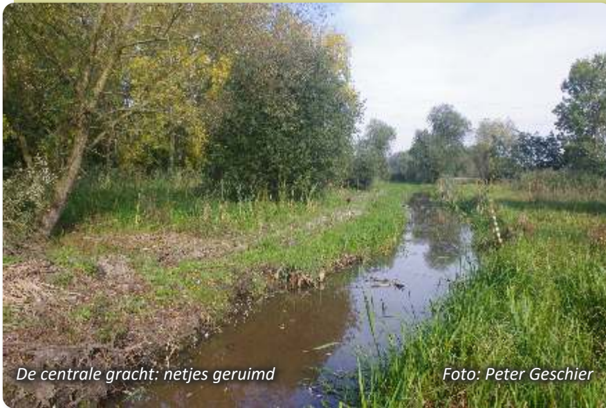
De centrale gracht: netjes geruimd

Weinige weken later verscheen ook de langverwachte kraan. Nu lag het in onze door IKEA-sleuteltjes mogelijk wat misvormde bedoeling dat de uitgebaggerde specie netjes uitgestreken als een instant verhoogd wandelpad op die gemaaide strook langsheen de grachten zou komen te liggen.