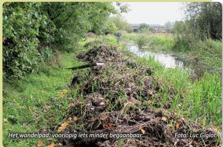
Het wandelpad: voorlopig iets minder begaanbaar...

Wat het resultaat zal zijn, weet ik vandaag nog niet. Waarschijnlijk bewegen we vanaf het laatste deel van oktober nog stijver en strammer dan gebruikelijk en voor de rest moet je zelf maar eens een keer komen kijken.