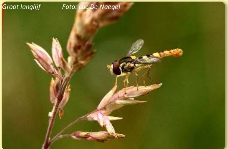
Groot langlijf