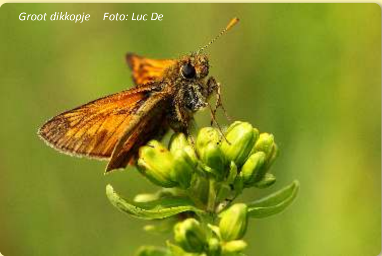
Groot dikkopje