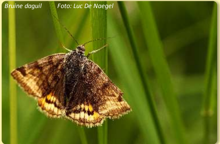
Bruine daguil