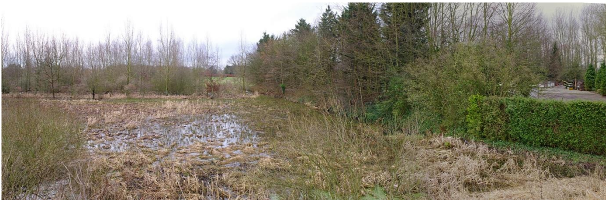
Panorama op het springbos dat in de winter nog overstroomt, maar helemaal verruigd is door het voedselrijk afvalwater. Dit gebied is niet geschikt voor de landbouw en kan maar beter natuurgebied worden. Je ziet ook heel goed de illegale dam van het domein De Rode Pen van 4 meter boven het oorspronkelijk maaiveld rechts die het springbos isoleert van de rest van de Goorbosbeekvallei.

Mogelijke subsidiekanalen: http://www.rrl.be/projecten/gebiedsgerichte-werking/open-ruimte-en-om-mechelen/5223 en/of www.waterlandschap.be