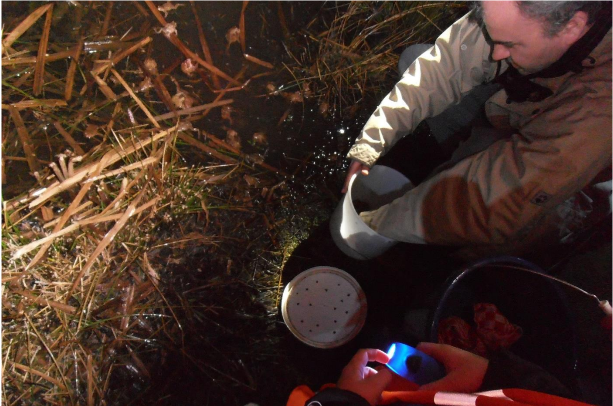
Padden worden na telling in de Babbelbeekse Beemden veilig vrijgelaten