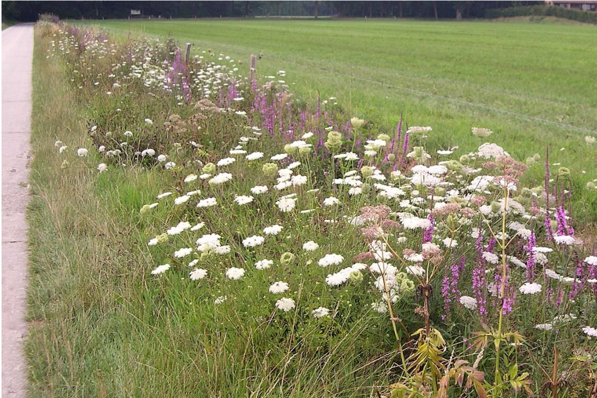
Bloemrijke bermen door een correct bermbeheer