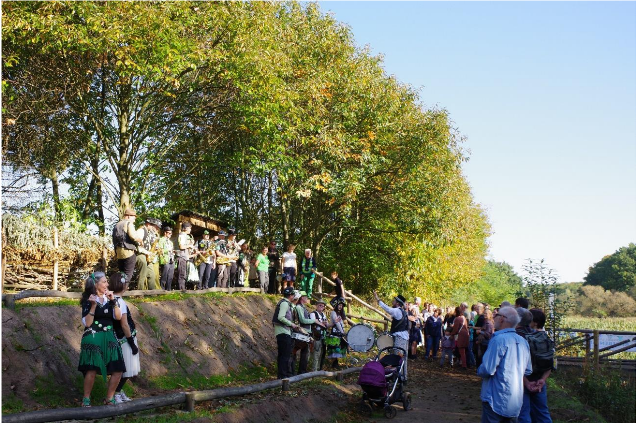
Inhoudiging van de vogelkijkwand met wandelbrug tijdens het Curieuzenezemosterpot landschapsfeest