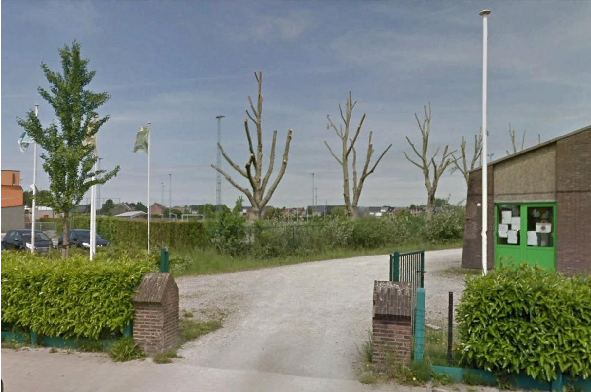
De in april 2017 gekandelaarde grauwe abelen