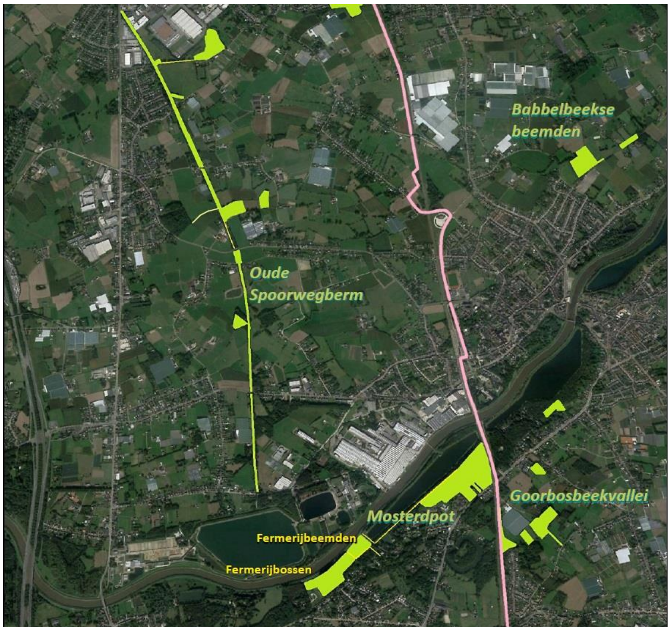
Overzicht van de gronden waar Natuurpunt actief is, onze kroonjuwelen