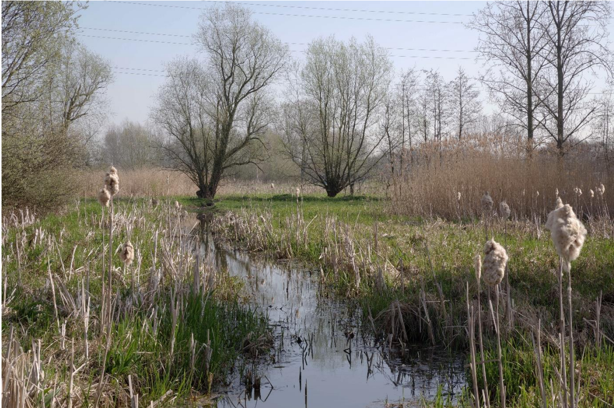
Het in 2016 aangekochte perceel in de Babbelbeekse Beemden