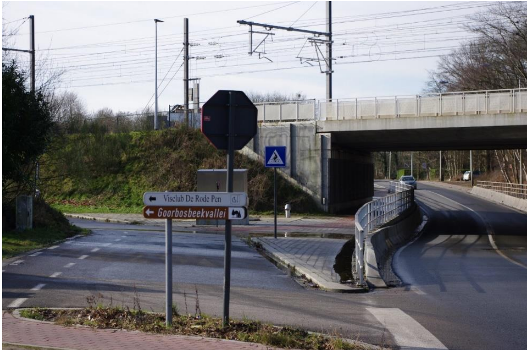
Bewegwijzering naar de Goorbosbeekvallei vanaf de Mechelsebaan

https://www.liedekerke.be/menu/milieu/natuur-en-groen/natuur-en-bosgebieden